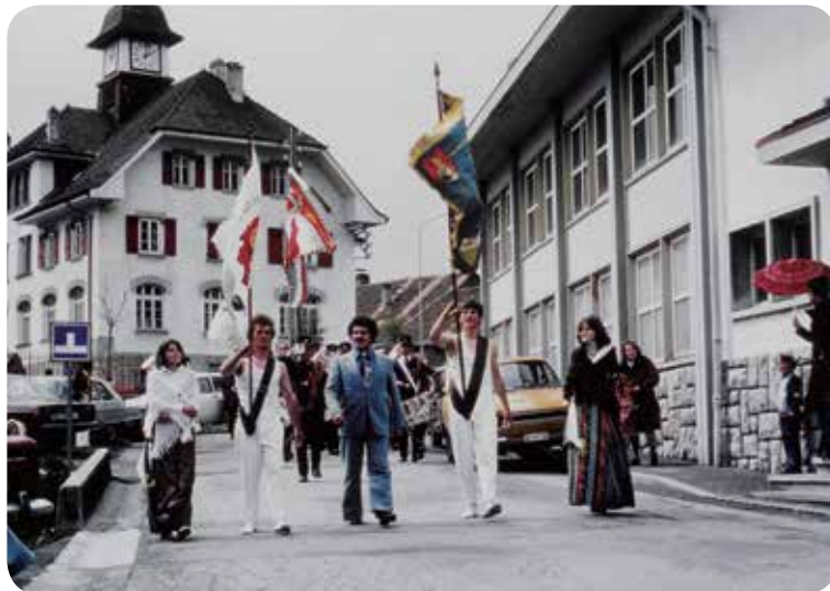
1977: Inauguration du drapeau.