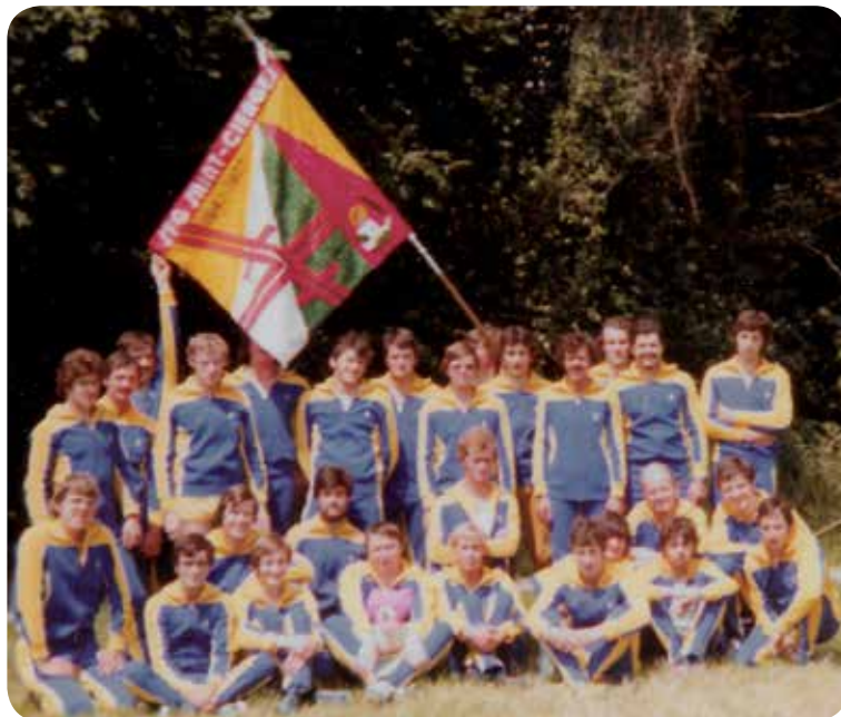
1978: Fête fédérale à Genève.