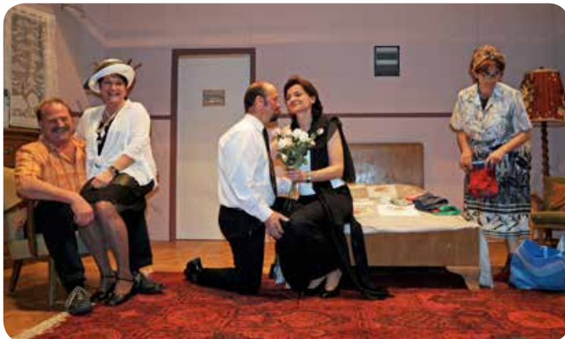
2010: Pièce de théâtre «C'est complet» au souper de soutien.

ment le début de la collaboration active avec la Gym-Hommes qui devient cellule logistique camping pour la Société. C'est en effet à cette période que nos hommes prennent pour habitude (très bonne habitude d'ailleurs) de s'occuper d'installer le camping avec tout le confort nécessaire à passer un bon et beau week-end.