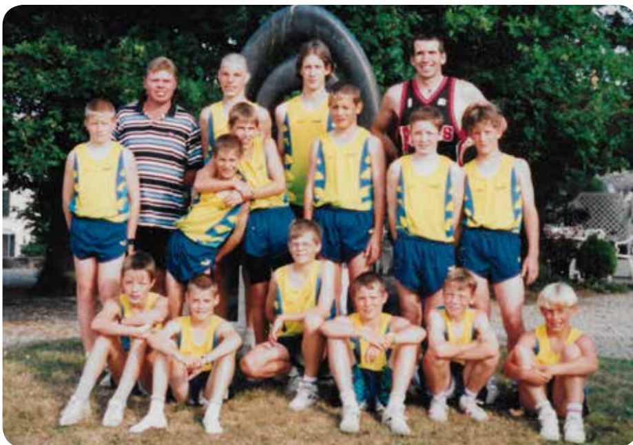
1998: Le groupe athlétisme à Sion.