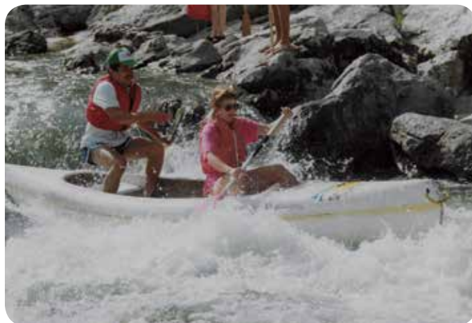
1988: Sortie en Ardèche.

Une marche d'environ deux heures agrémentée de jeux d'adresse ou de réflexion disséminés tout au long du parcours.