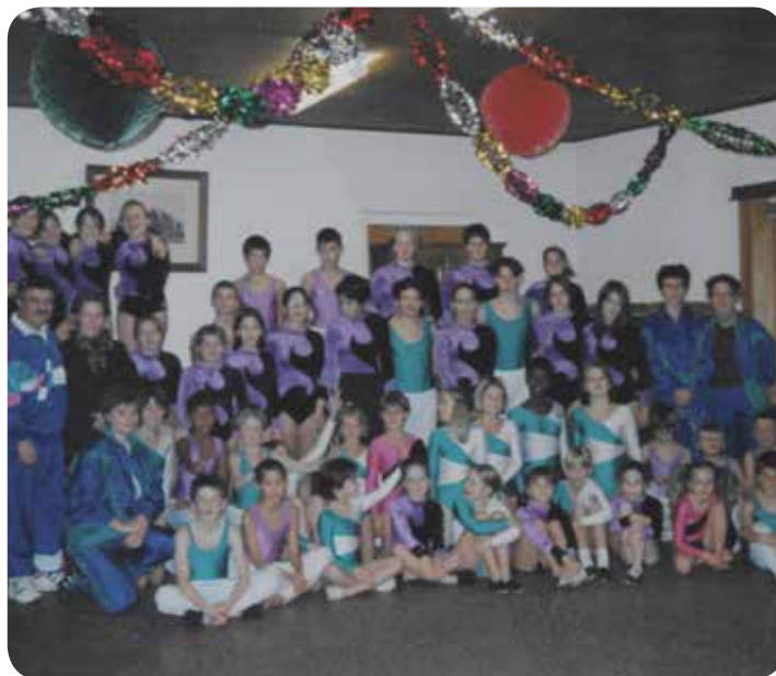
1996: Soirée, groupe agrès.

C'est également durant ces années-là que le groupe actifs agrès voit le jour (2001) avec pour objectifs de participer à la Fête fédérale de Liestal en 2002 en société ce qui sera chose faite avec une production en combinaison d'engins. Ce sera d'ailleurs la seule participation en société à une Fête fédérale à ce jour de ce groupe.