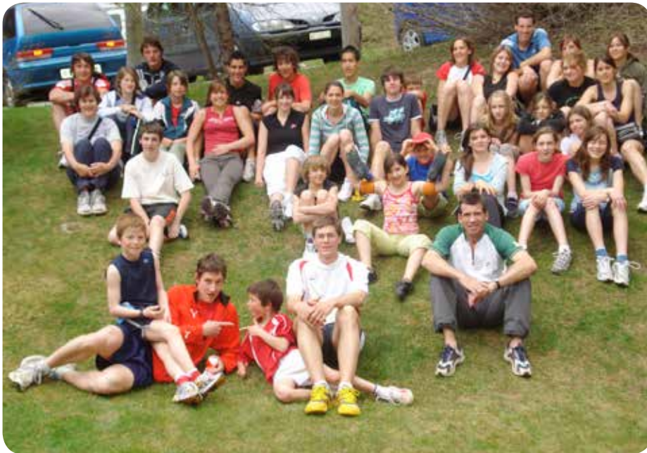
2008: Camp à Ovronnaz.