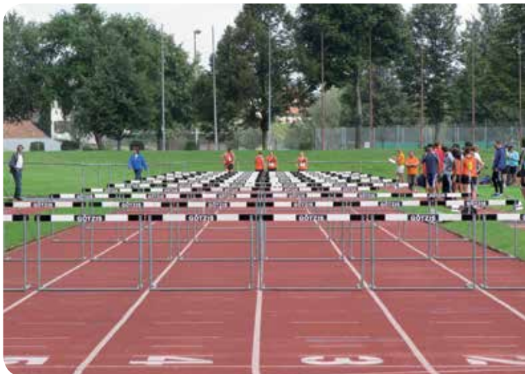
2010: Heptatlon à Götzis (Autriche).

Pour s'occuper de cette jeunesse qui accroît d'année en année, de nombreux moniteurs s'investissent et se forment en suivant les cours Jeunesse & Sport. Les entraînements sont de qualité, surtout avec la réfection du terrain de sport de St-Cierges.