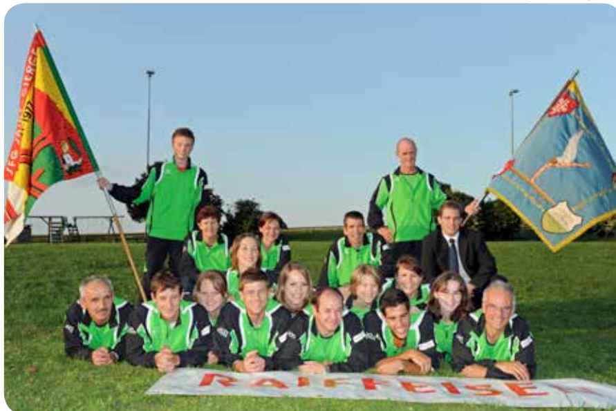
2012: Les moniteurs.