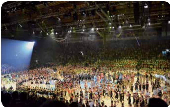
2011: 14 e Gymnaestrada à Lausanne. Soirée suisse.