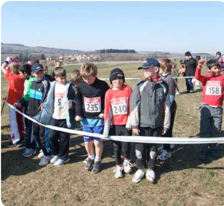
2009: Cross Broye-Jorat.

Le 7 avril 2001, l'Association Vaudoise de Gymnastique Féminine et la Société Cantonale Vaudoise de Gymnastique fusionnent et donnent naissance à l'Association Cantonale Vaudoise de Gymnastique.