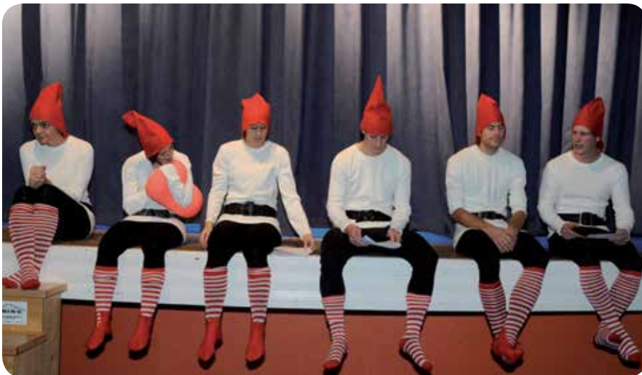
2012: Commission soirée.

L'année 2007 est également marquée par la Fête fédérale de Frauenfeld. Notre équipe 35+ reviendra de ces joutes avec une magnifique 4 e place dans sa catégorie. Cette fête marque égale-