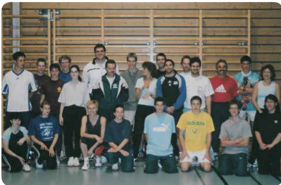
2002: Présence de Werner Günthör, spécialiste du lancer du poids, triple champion du monde de la discipline de 1987 à 1993. Médaillé de bronze aux Jeux olympiques de Séoul en 1988.