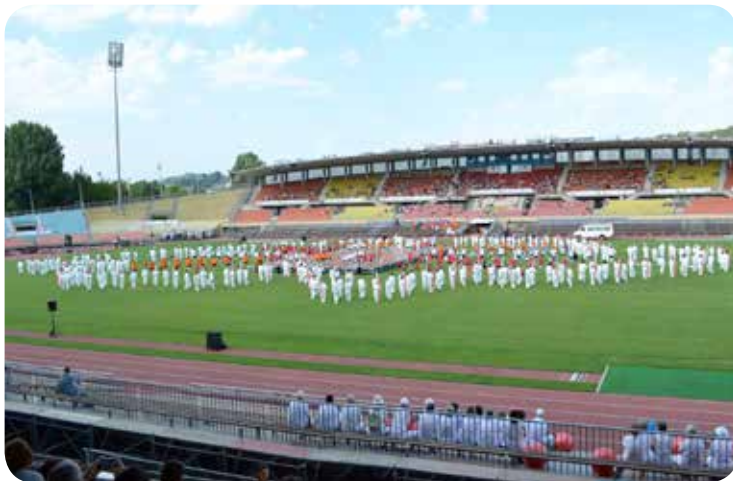
2011: 14 e Gymnaestrada à Lausanne. Répétition de la cérémonie d'ouverture à la Pontaise.

C'est en 2014 que le groupe a enfin pu prendre ses quartiers avec des horaires fixes en un seul et même lieu, à Bercher, avec tout le matériel nécessaire à notre pratique.