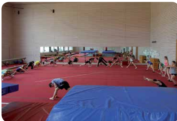
2012: Entraînement à Aigle.

C'est également cette année-là que le comité propose une refonte des statuts de la Société. Ceux que nous avions dataient de 1995 et avaient besoin d'un rafraîchissement suite aux divers changements opérés au sein de la gymnastique vaudoise.