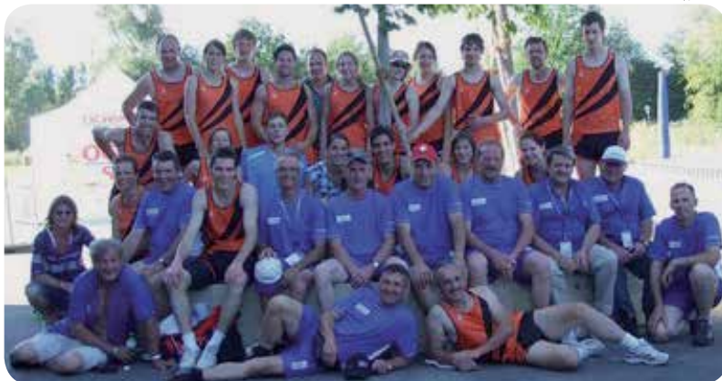
2009: Cantonale soleuroise à Subingen.

Ce dernier propose même des fêtes de gymnastique en terre bâloise, soleuroise et seelandaise à ses gymnastes, sans oublier l'équipe de joyeux lurons sportifs de la Gym-Hommes.