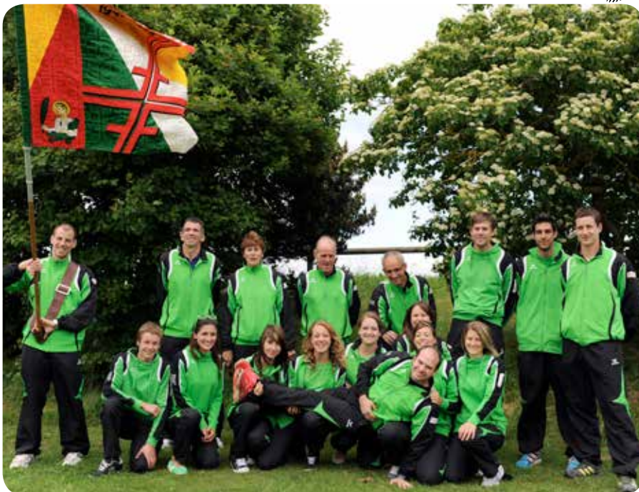
2013: Les moniteurs de retour de la Fédérale de Bienne.