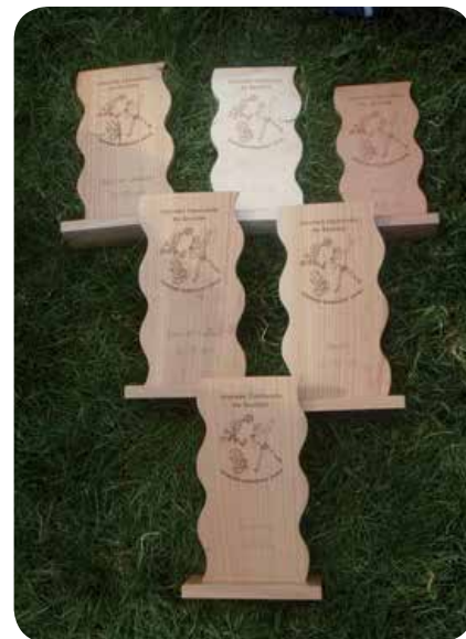
2008: Coupes gagnées à Dorigny.

Fête fédérale à Liestal: 1 re participation des jeunes dans une Fête fédérale. Concours société avec Lucens pour avoir plus de chance d'obtenir un podium. Pari réussi avec une 3 e place. 2 e participation à une Fédérale à Frauenfeld toujours en collaboration avec la Société de Lucens. Puis en 2013, il est décidé en commun accord entre athlètes et moniteurs de concourir en portant uniquement les couleurs de St-Cierges.