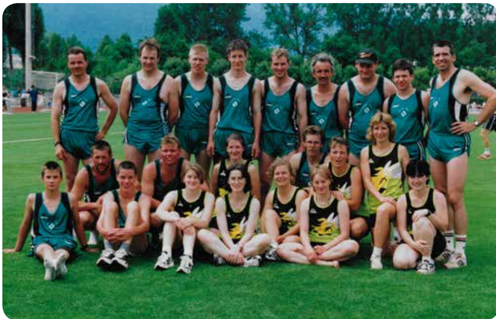
1999: Fête romande à Delémont.

L'évolution de notre Société, durant ces années, nous a obligé à trouver de nouvelles rentrées d'argent pour le bon fonctionnement de nos groupes. C'est ainsi que nous avons organisé jusqu'à 3 lotos par année et une deuxième représentation pour notre soirée annuelle.