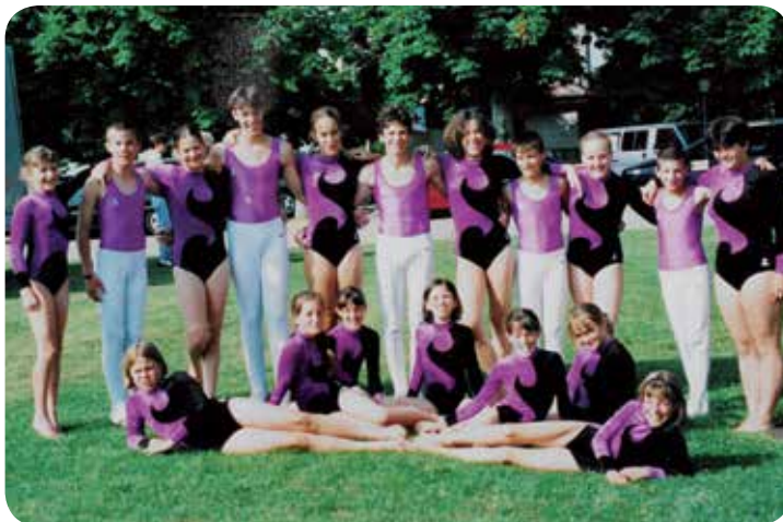
1998: Le groupe Agrès au Championnat vaudois à Aubonne.

C'est également durant ces années que le nombre de gymnastes explose avant de se stabiliser au environ de 50 gymnastes en jeunesse pour la partie agrès.