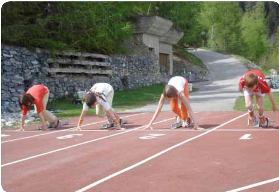
2008: Camp à Ovronnaz.