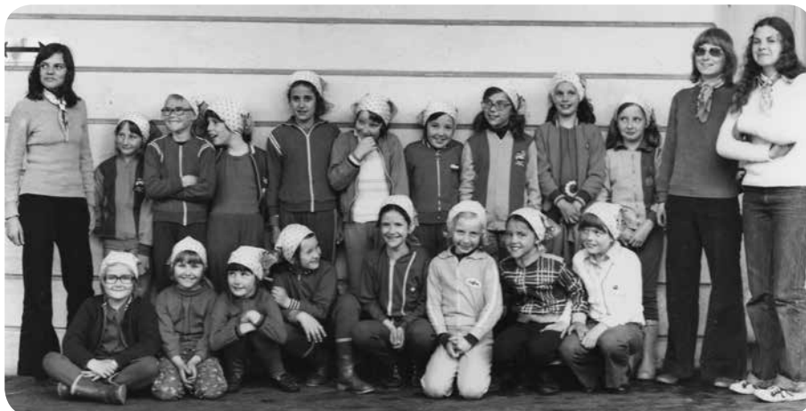
1974: Cantonale des pupillettes à Moudon.

La nouvelle sous-section de la Gym-Hommes est fondée par 7 amis sportifs d'âge mur, le 3 février 1960. Leur principale activité est le volley-ball.