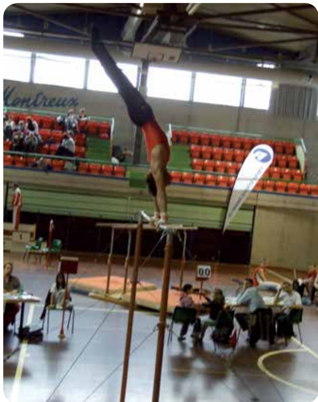
Gymnaste au reck.

Ce nouveau planning implique d'avoir un nombre plus conséquent d'entraîneurs à disposition pour encadrer