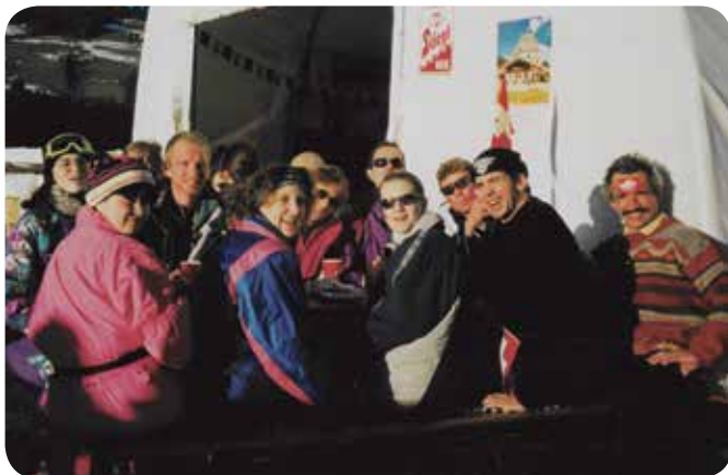
1999: Sortie à Kitzbühel.

A midi, le comité se charge de remplir les estomacs affamés des marcheurs pour une journée de convivialité.