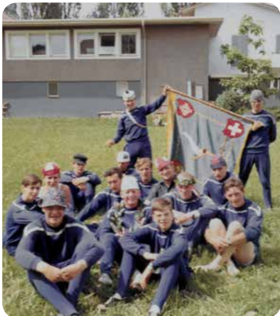
1967: Fête fédérale à Berne.