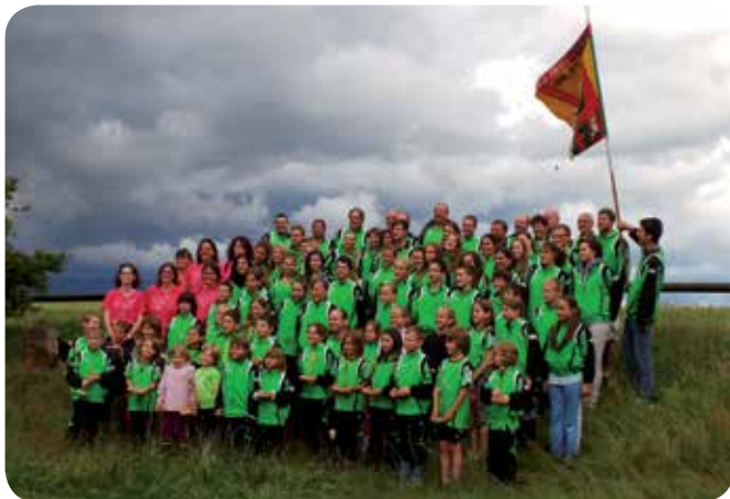
2014: Retour de la Cantonale de Bière.