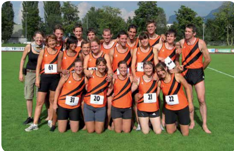
2010: Heptatlon à Götzis (Autriche).

Dans les années 2000, la Société se déplace aux concours accompagnée de la Gym-Hommes, qui, après la partie sportive, s'occupe du campement et du ravitaillement pendant que les actifs terminent leurs disciplines. L'ambiance est assurée au campement et commence à être enviée des autres sections.