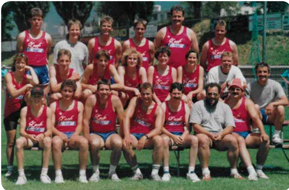
1993: Fête romande à Martigny.