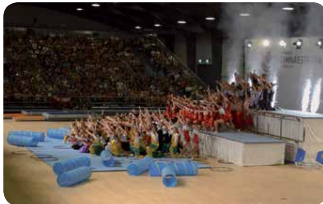
2011: 14 e Gymnaestrada à Lausanne, groupe vaudois.