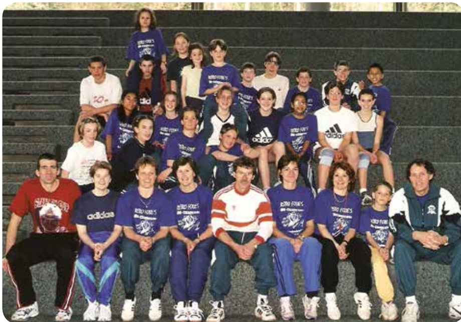
2001: Camp à Macolin.